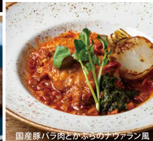
国産豚バラ肉とかぶらのナヴァラン風