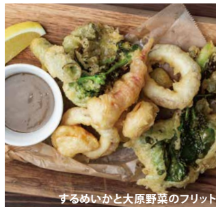
するめいかと大原野菜のフリット