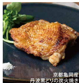
京都亀岡産 丹波黒どりの炭火焼き

Beef Steak & French Fries with BBQ Sauce