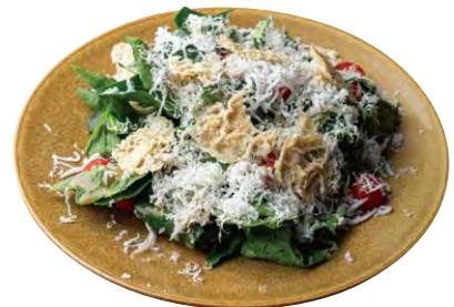
和歌山県産釜揚げしらすと ほうれん草、 パルミジャーノのサラダ 1280 White bait & Spinach Salad