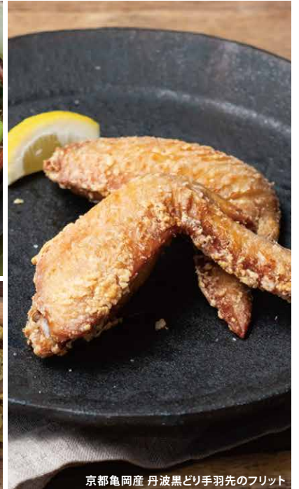
京都亀岡産 丹波黒どり手羽先のフリット