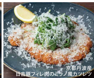
京都丹波産 日吉豚フィレ肉のミラノ風カツレツ