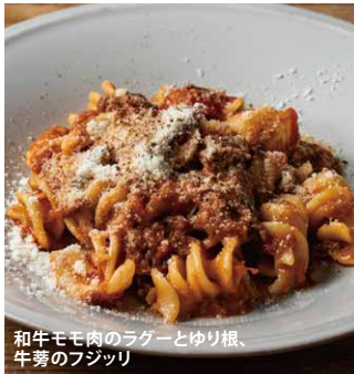
和牛モモ肉のラグーとゆり根、牛蒡のフジッリ