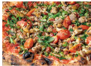
サラメ ピカンテ 1900

● トマトソース ● 九条ネギ ● ピカンテサラミ ● サルシッチャ ● マッシュルーム ● ミニトマト ● 青唐辛子 ● にんにくスライス ● 黒七味