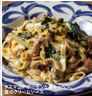
タスマニアサーモンと黒キャベツ、茸のクリームソース