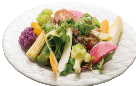
プティフェルム 1050 Farmers Salad