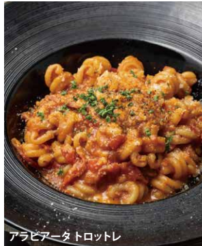
アラビアータ トロツトレ