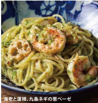
海老と蓮根、九条ネギの葱ベーゼ