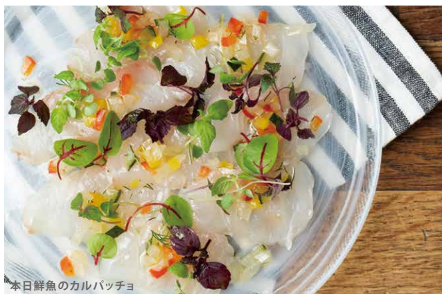
本日鮮魚のカルパッチョ