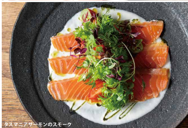
タスマニアサーモンのスモーク