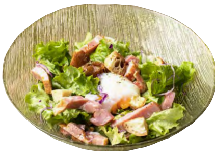
ベーコンと温度卵の リヨン風サラダ 1050 Salade Lyonnaise