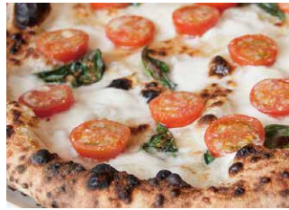
DOC水牛モッツアレラとチェリートマト 2400