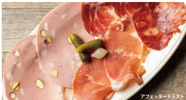
アフエッタートミスト