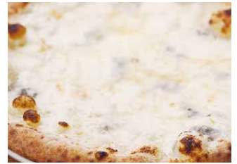
クワトロフォルマッジ 2400

“ピッツァ=チーズ”の常識を覆す一枚 お酒のお供にもピッタリでファン続出 *チーズ不使用