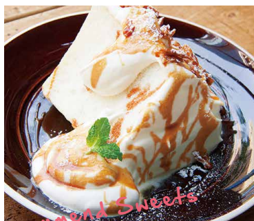
Angel Food Cake Vanilla Caramel 700 エンゼルフードケーキ バニラキャラメル

しっとりフワフワ真っ白な生地に たっぷりのクリームとキャラメルソース。 ボリューム満点の人気スイーツ!