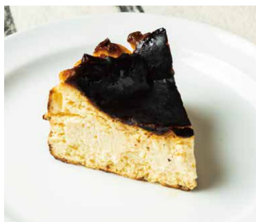
Burnt Basque Cheesecake 780 バスクチーズケーキ

たまごの卵白だけを使用した生地に、 たっぷりのクリーム、 こちらはショコラソースとともに。