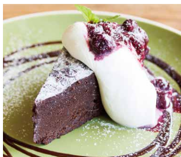
Gâteau au Chocolat 700 ガトーショコラ

チーズをたっぷりとつかい 濃厚な味わいに。 バニラ香る甘さ控えめの 大人のチーズケーキ。