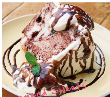
Angel Food Cake Chocolate 700 エンゼルフードケーキ ショコラ

しっとりフワフワ真っ白な生地に たっぷりのクリームとキャラメルソース。 ボリューム満点の人気スイーツ!