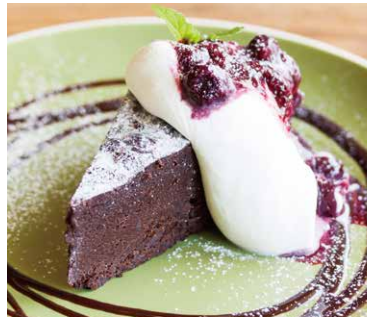
Gâteau au Chocolat 800 ガトーショコラ

チーズをたっぷりとつかい 濃厚な味わいに。 バニラ香る甘さ控えめの 大人のチーズケーキ。