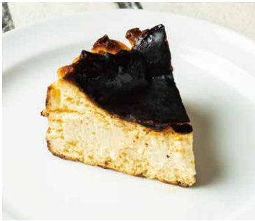
Burnt Basque Cheesecake 900 バスクチーズケーキ

たまごの卵白だけを使用した生地に、 たっぷりのクリーム、 こちらはショコラソースとともに。