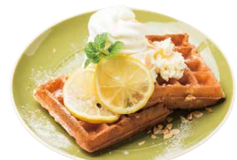
はちみつレモンと 塩バターのワッフル Honey Lemon & Salted Butter Waffle