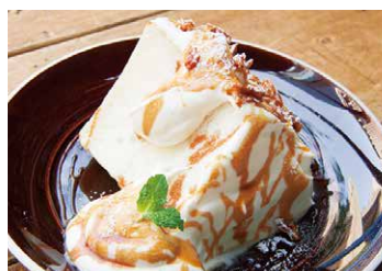
エンゼルフードケーキ バニラキャラメル Angel Food Cake Vanilla Caramel