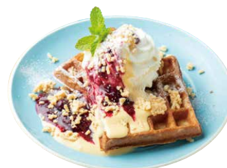
ベリーカスタードワッフル Berry Custard Waffle