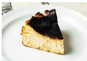
バスクチーズケーキ Burnt Basque Cheesecake