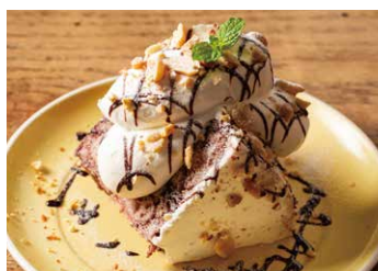
エンゼルフードケーキ ショコラ Angel Food Cake Chocolate