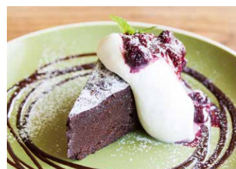
ガトーショコラ Gâteau au Chocolat