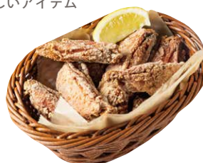
スパイシーチキンウィング 820 Spicy Chicken Wing *辛さをなしにできます。