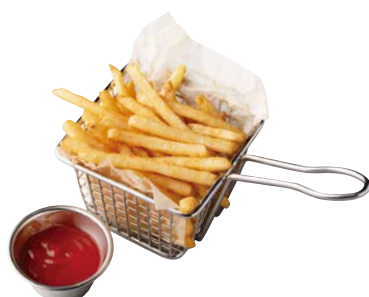
フレンチフライ French Fries