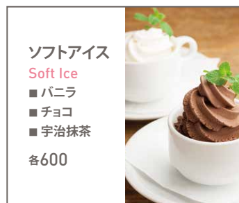
ソフトアイス Soft Ice ■バニラ ■チョコ ■宇治抹茶 各600